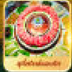
ชุดโขนแบบดั้งเดิม