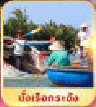
บือเรือทระดง