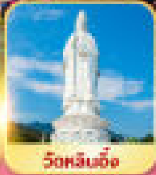
วัดหิมฮง