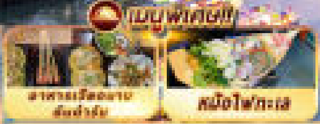
อาหารเวียดนาม สี่เดีววัน