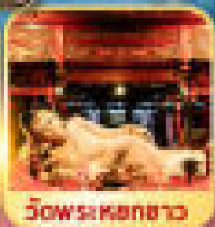
วัดพระหลอกขาว