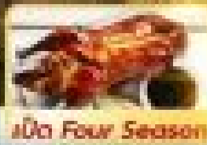
มื้อ Four Season