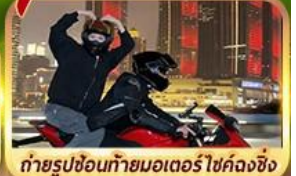
OPTION!! ถ่ายรูปขี่มอเตอร์ไซด์หลงซิง