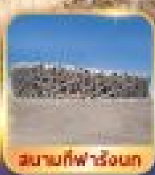
สนามกีฬาชิงกิง