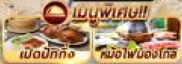
เบ็ดปักกิ่ง