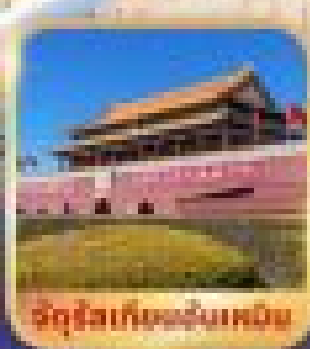
จุดไฮไลท์วันพิเศษ