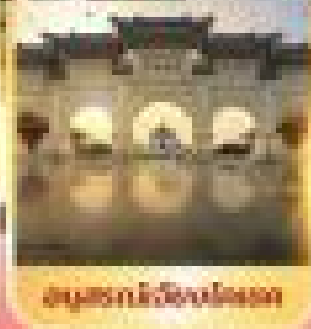
อนุสาวรีย์จงชวี่