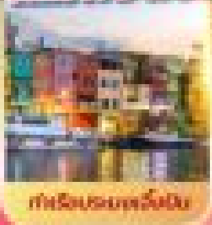
ศาลเจ้าแม่กวนอิมพันมือ