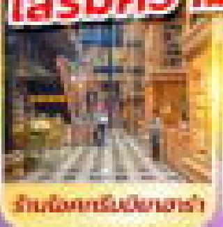
วัดโลกทวันเป่ย์กาศำ