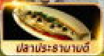
ปลากระพงทอด