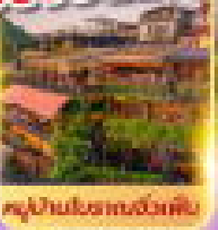
สุ่ยเป่ย์เอ๋อชานฉีงเฟ่ย์