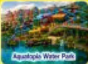
Aquaplus Water Park