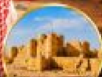
กลุ่มปราสาททะเลทราย (Desert Castles)