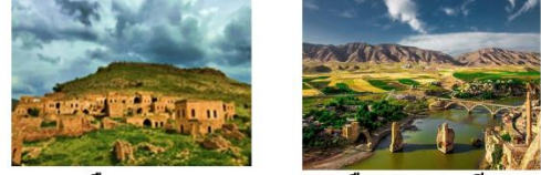
เมืองดารา เมืองฮาซานคีฟ

** พักที่ Kardelen Hotel 4* หรือเทียบเท่า **