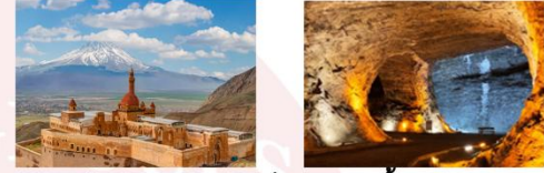
พระราชวังอิซฮาก พาชาร์ ถ้ำเกลือ

** พักที่ Kale Hotel 4* หรือเทียบเท่า **