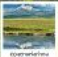
ยอดเขาหิมะ

กรุ๋ฉวนกั๋วหนานหนาน • จู๋หนานฉีตง • หลินเต๋อ • ป๋าย่เอ๋อ หลินเต๋อ • หลินเต๋อ • หลินเต๋อ • หลินเต๋อ • หลินเต๋อ กรุ๋ฉวนกั๋วหนานหนาน • หลินเต๋อ • หลินเต๋อ • หลินเต๋อ กรุ๋ฉวนกั๋วหนานหนาน • หลินเต๋อ • หลินเต๋อ • หลินเต๋อ