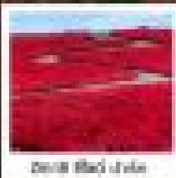
Bond Field ไร่ส้ม