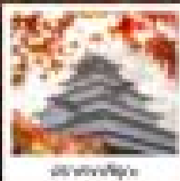
สวนเบญจกิติ