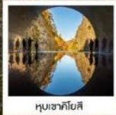
หุบเขาคิโยสึ