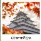
ปราสาทสิรุกะ