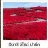
ฮิตาชิ ซีไซด์ พาร์ค