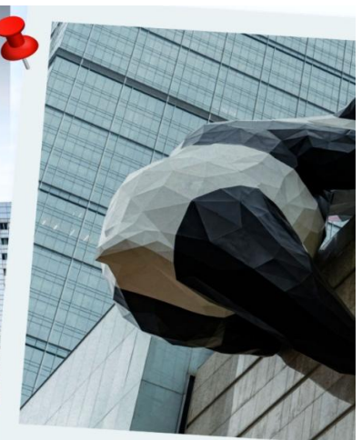
○ แพนด้ายักษ์ป็นติก