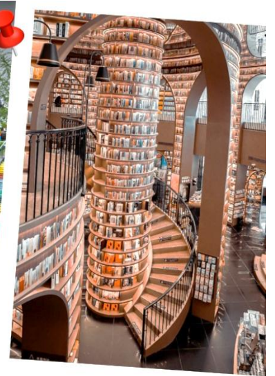
○ จัตุรัสหยางเทียนวู แพนด้าเซลฟี และ ห้องสมุดงงชุกอ