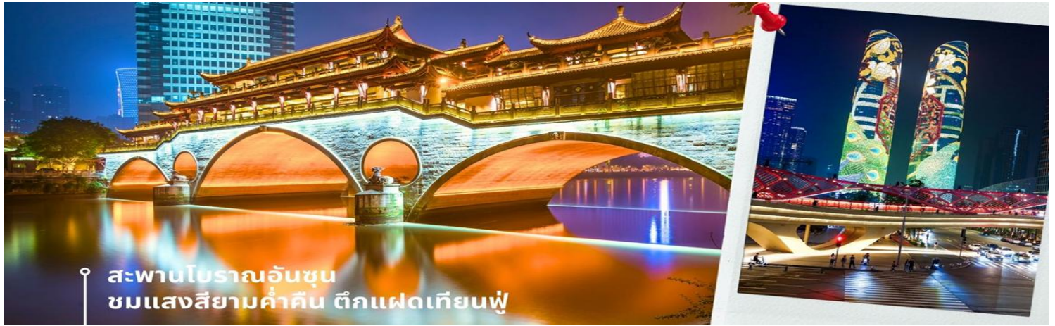
สะพานโบราณอันชุน ชมแสงสียามค่ำสิน ดึกแฝดเทียนฟู

นำท่านชม สะพานโบราณอันชุน-พร้อมชมแสงสียามค่ำสิน ดึกแฝดเทียนฟู เป็นสะพานข้ามคลองที่สร้างเป็นเหมือนอาคารอยู่ข้างบน ในช่วงเวลายามเย็นจะเป็นช่วงที่ผู้คนออกมาชมบรรยากาศบริเวณของสะพานแห่งนี้ และมีร้านค้ามากมาย รวมไปถึงบาร์เครื่องดื่มต่างๆ ที่ดึงดูดนักท่องเที่ยวได้เป็นอย่างดี เป็นสะพานที่ทอดข้ามแม่น้ำจินเจียง และเป็นรูปแบบสะพานมีหลังคา ตามลักษณะสถาปัตยกรรมจีนโบราณ อายุมากกว่า 300 ปี และในบริเวณใกล้เคียงยังเป็นที่ตั้งของ ดึกแฝดเทียนฟู โดยในช่วงค่ำเวลา ประมาณ 19.00-22.00 น. ทั้ง 2 ดึกจะเป็นไฟ LED สวยงามโดดเด่นมาก ดึกแฝดเทียนฟู หรือที่เรียกอย่างเป็นทางการว่าตึกศูนย์การเงินนานาชาติเทียนฟู เป็นตึกกระจาที่สวยงามโดดเด่นสองตึกในย่านการเงินของเฉิงตู ดึกแต่ละตึกมีความสูง 58 ชั้นและสูงกว่า 700 ฟุต ดึกเหล่านี้โดดเด่นเป็นพิเศษด้วยภายนอกที่หุ้มด้วยไฟ LED ที่เป็นเอกลักษณ์ ซึ่งเปลี่ยนอาคารให้กลายเป็นจอภาพดิจิทัลขนาดใหญ่