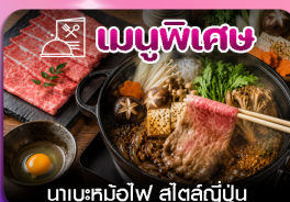
นาเบะคินิวไฟ สัตสด์ญี่ปุ่น