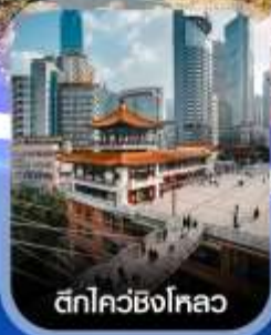
ตึกไควซิงโหลว

✈️ คอนเฟิร์มออกเดินทาง ทุกพีเรียด 2 ท่านขึ้นไป