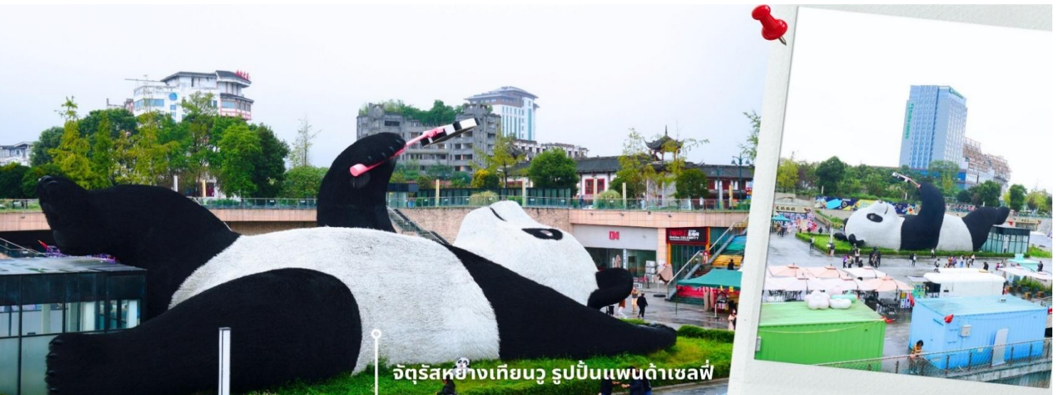
จัตุรัสหย่างเทียนวู รูปปั้นแพนด้าเซลฟี

นำท่านเที่ยวชม จัตุรัสหย่างเทียนวู เป็นจุดเช็คอินที่สำคัญสำหรับคนที่มาเที่ยวที่ เมืองตูเจียงเยียน บริเวณจุดต่ำข่าอำเภอดูเจียงเยียน นครเฉิงตู ไฮไลท์ของจัตุรัสหย่างเทียนวู คือ ประติมากรรม แพนด้ายักษ์ที่กำลังนอนหงายท้อง ยื่นมือถือไม้เซลฟีสีชมพู ซึ่งออกแบบโดยนักออกแบบชื่อดัง Florentijn Hofman รูปปั้นแพนด้า ยักษ์มีความยาว 26 เมตร กว้าง 11 เมตร สูง 12 เมตร และหนัก 130 ตัน แบบท่าทางสบายๆของแพนด้าที่ความประทับใจและรอยยิ้ม