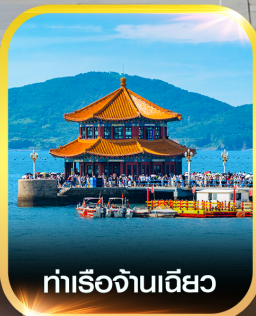
ท่าเรือจันทิว

คอนเฟิร์มออกเดินทาง ทุกพีเรียด 2 ท่านขึ้นไป