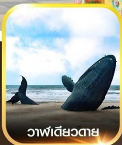
วาฬเดี่ยวตาย

คอนเฟิร์มออกเดินทาง ทุกพีเรียด 2 ท่านขึ้นไป