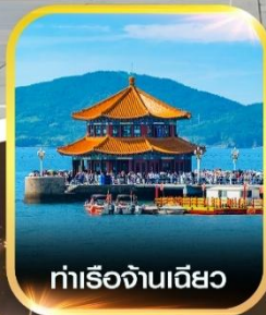
ท่าเรือฉางเฉียว