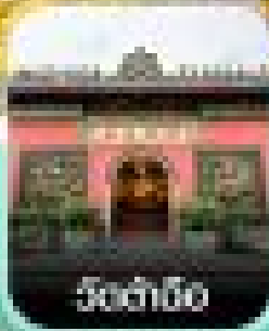
วัดต้าเถียว