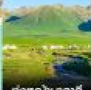
ทุ่งหญ้าเนาล่าตี้