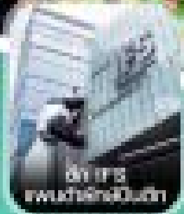
ขี่ม้า ชมทุ่งหญ้าเนาล่าตี้