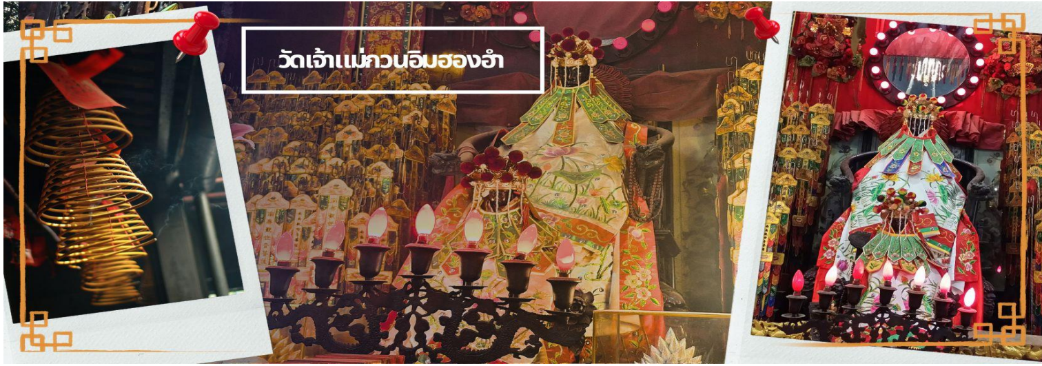
วัดเจ้าแม่กวนอิมของอำ

จากนั้นนำท่านชม โรงงานจิ๋วเวอรี ซึ่งเป็นโรงงานที่มีชื่อเสียงที่สุดของฮ่องกงในเรื่องการออกแบบเครื่องประดับ อาทิเช่น จี้ และแหวนกำหัตน์ ที่สวยงามโดดเด่นไม่เหมือนใคร ซึ่งถือกำเนิดขึ้นที่นี่และมีชื่อเสียงที่สุดใช้เป็นเครื่องประดับติดตัว และเสริมดวงชะตา สินค้าทุกชิ้นมีเอกสารรับประกันคุณภาพเปลี่ยน ซ่อม ได้ตลอดอายุการใช้งาน หากเกิดการชำรุดจากสินค้า ไม่ใช่อุบัติเหตุ