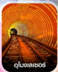
อุโมงเลเซอร์

✈️ คอนเฟิร์มออกเดินทาง ✈️ ทุกพีเรียด 2 ท่านขึ้นไป