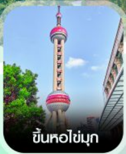
ขึ้นหอไข่มุก