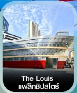
The Louis แฟล็กชิปไฮสตา