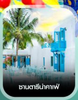
ซานตริ่นคาเฟ