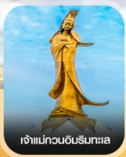
เจ้าแม่กวนอิมรินทะเล

คอนเฟิร์มออกเดินทาง ทุกพีเรียด 2 ท่านขึ้นไป