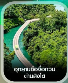
อุทยานซีจื่อกวน ด่านสิงโต