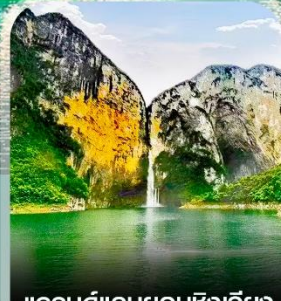
แกรนด์แคนยอนซิงเจียง