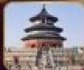
หอคอยทิเบต