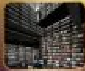
กำแพงเมือง