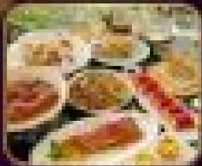
อาหารจีน 4 วัน