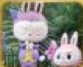
สวนสนุกป๊อปแลนด์