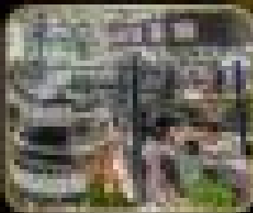
อาคารเก่า WAREHOUSE NO.3