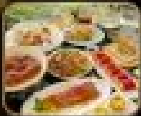
อาหารค่ำค่ำ TAO TAO JU