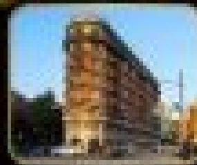
สถาปัตยกรรม WUKANG MANSION