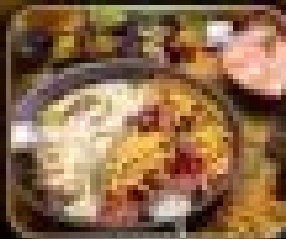
อาหารค่ำค่ำ สุกี้ หมี่ไฟฟู้อร้อน