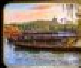
วิว ถนนสายมรดก