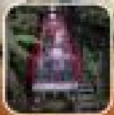
บริการรถรับส่งสนามบิน