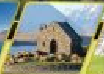
ทะเลสาบเทคาโป