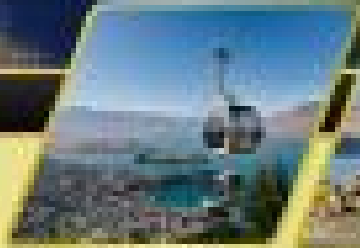
บ้าน-เจ้าทอว์นส์