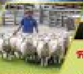
สวนสัตว์ควีนส์ทาวน์