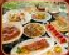
อาหารจีนแท้ TAO TAO JU