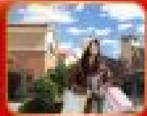
ศูนย์การค้า BEIJING OUTLET