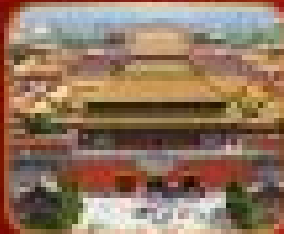
วัดโบราณ พระธาตุวิญญา