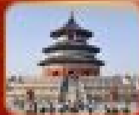
วัดโบราณ หอฟ้าเทียนถาน