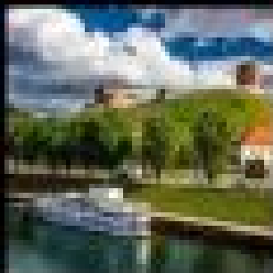
เอสโตเนีย