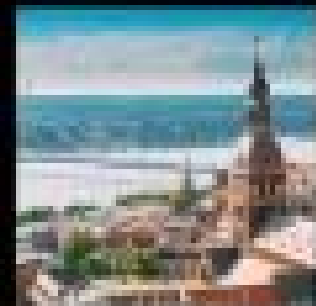
ลิทัวเนีย