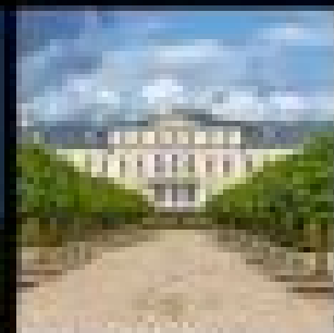
เมืองหลวง