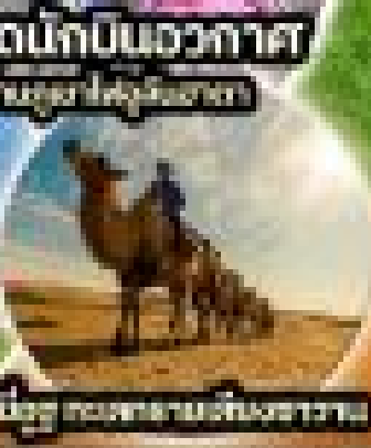
ขี่อูฐ ทะเลทรายอูลันฮาตา

ตั๋วเครื่องบิน | 1kg + นกทะเลทราย | โรงแรม ดี 5 ดาว | ทะเลทรายอูลันฮาตา | ทะเลทรายไฮฮอก | โทร HOWHOT