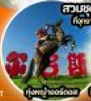
ขี่ม้าชมทุ่งหญ้า