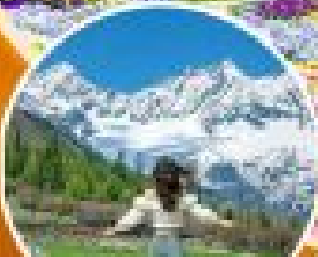
ภูเขาสีดรุณี อสังการอบบอร์รี่ (Sudrunee)