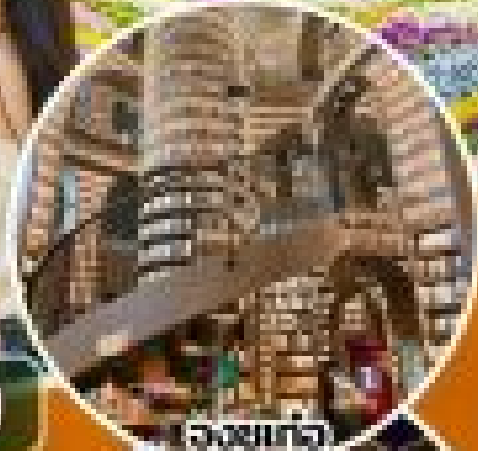
อสังการอบบอร์รี่

รวมค่าตั๋วเครื่องบินไป-กลับ (THAI AIRWAYS INTERNATIONAL) และค่าประกันการเดินทาง (TRAVEL INSURANCE) สำหรับเที่ยวบินไป-กลับ กรุงเทพฯ-เจียงตู