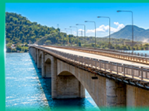
สะพานมิตรภาพลาว - สิบปัน