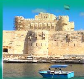
บิอุมปราการ Quite Bay