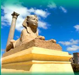
เสาสีมันปอมเบย์