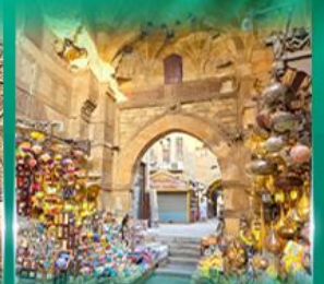
ตลาดท่านเอลกาลลี