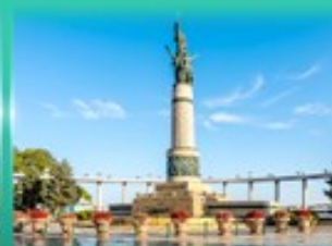
อนุสาวรีย์นิงหง