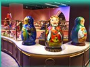
พิพิธภัณฑ์ ตุ๊กตาเป่ลือกอน