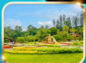
สวนบ้านปรน.เจียงไคเช็ก