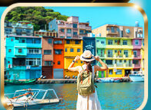
หมู่บ้านประมงเจิ้งปิ่น