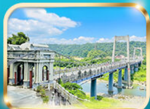
สะพานต้าชี เกาหยวน