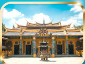
วัดต้าชี ขอความรวย