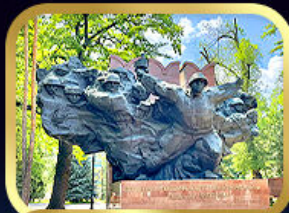
Panfilov Guardsmen Park