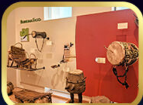
Museum of Folk Instrument