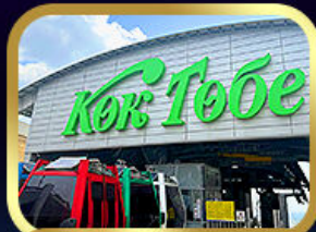
เซ็นทรัลโกทอบเชอวอัลมาตี

นั่งกระเช้าชิมบุลัก • ทะเลสาบโคลโซ • ซารินเกรนด์แคนยอน