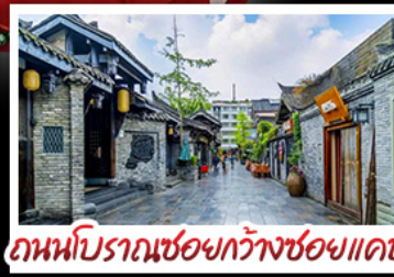
ถนนโบราณชอยกว้างชอยแคบ