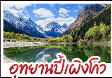
อุทยานปีเฟื่องไท่