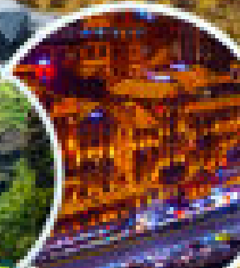
สะพานงาช้าง

**รวมค่าไปรษณีย์แล้ว กรุณาอ่านเงื่อนไขการจองก่อนจอง*