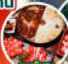
เมนูเลี้ยงช้าง ชาบูหม่าล่า