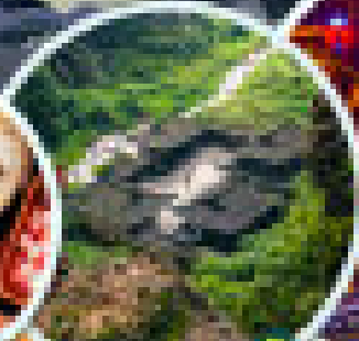
จุดชมทิวทัศน์ ศาลาสามสวรรค์