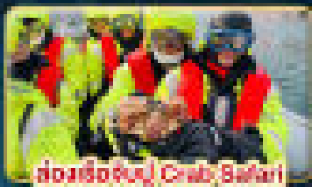
ล่องเรือชมปู Crab Safari

เยือนเมืองสองแห่งแสงเหนือ สัมผัสความสวยงามของนอร์เวย์ที่แท้จริง