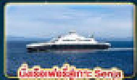
นั่งเรือเฟอร์รี่ข้าม Senja