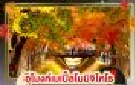
ขบวนแห่คางิโนะ