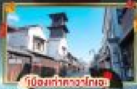
เมืองเก่าคาทาคิยะ