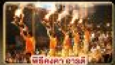
พิธีบูชาพระ