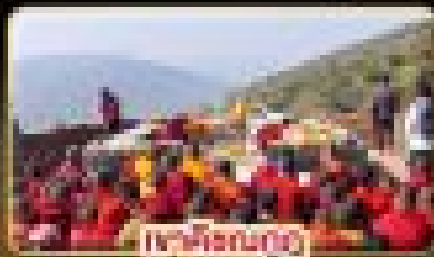
เทศกาลบูชา