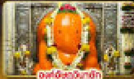
องค์สีทองขนาด