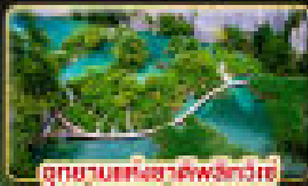
อุทยานแห่งชาติพลาทิวีต