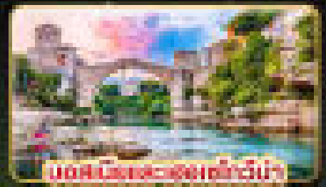
เมืองมรดกโลกแห่งสุดท้าย