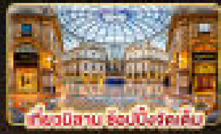
เที่ยวโรมาน รวมอียิปต์ด้วย