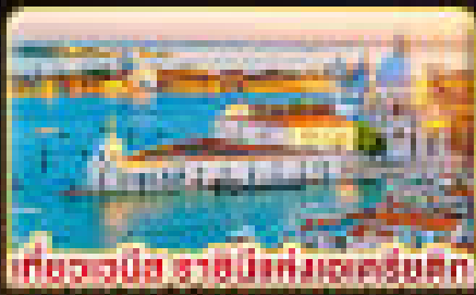
เที่ยวเวนิส ราชินีแห่งทะเลแอดริเอติก