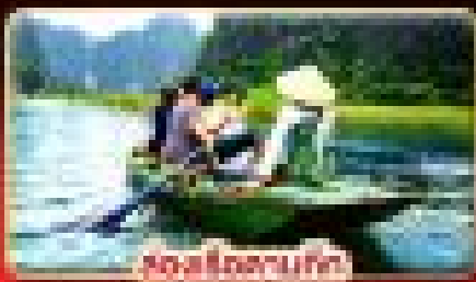
ล่องแก่งนันท