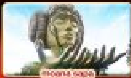
ชมความงาม