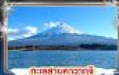
ทะเลสาบคาวากูจิ