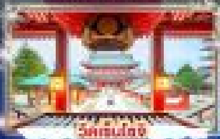
วัดชินโต

เที่ยวชมงานประเพณีไฟตกน้ำ SAGAMIKO ILLUMINATION เช็กอินसानสกี ชมวิวภูเขาไฟฟูจิ