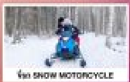
ขี่ SNOW MOTORCYCLE