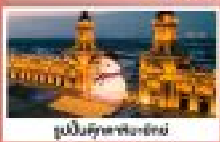
รูปปั้นหิมะที่เมือง